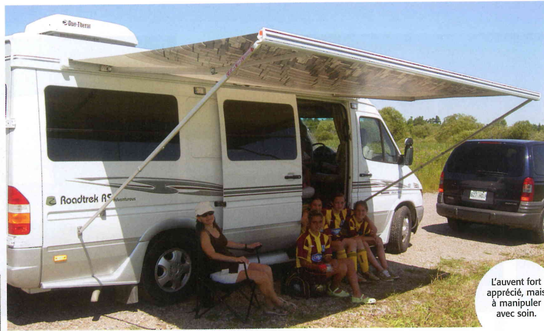
L'auvent fort apprécié, mais à manipuler avec soin.