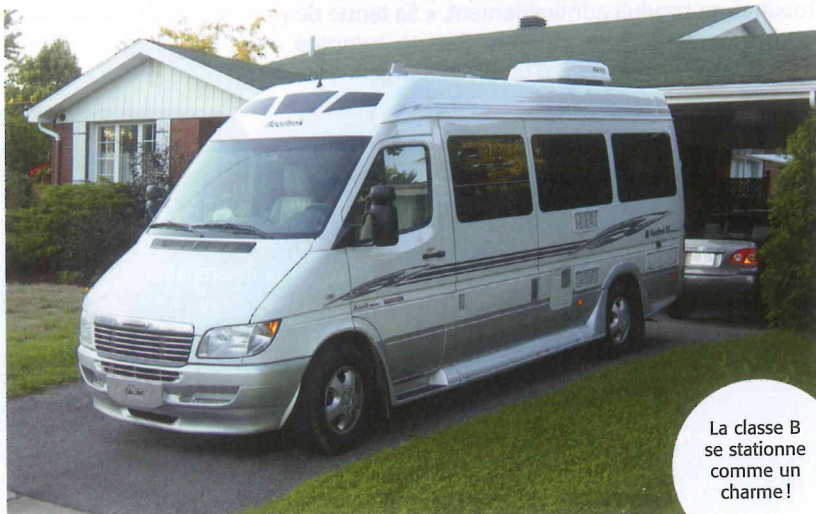
La classe B se stationne comme un charme !