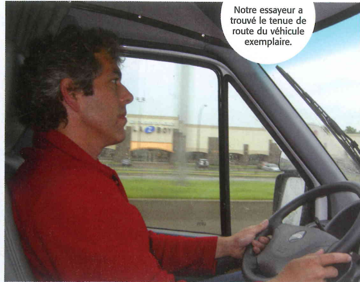
Notre essayeur a trouvé le tenue de route du véhicule exemplaire.